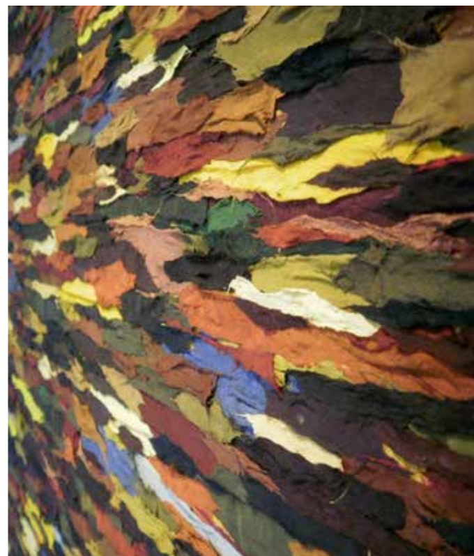
SAHAR BURHAN SAAB ART GALLERY 10/10–25/10

Utställningarna arrangeras med stöd av Sveriges Konstföreningar